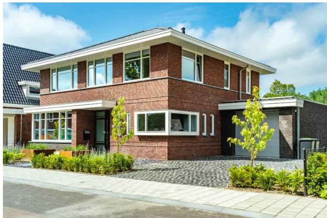
Nieuwbouw particuliere woning