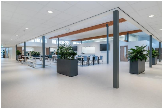
Renovatie Korczakschool in Middelburg