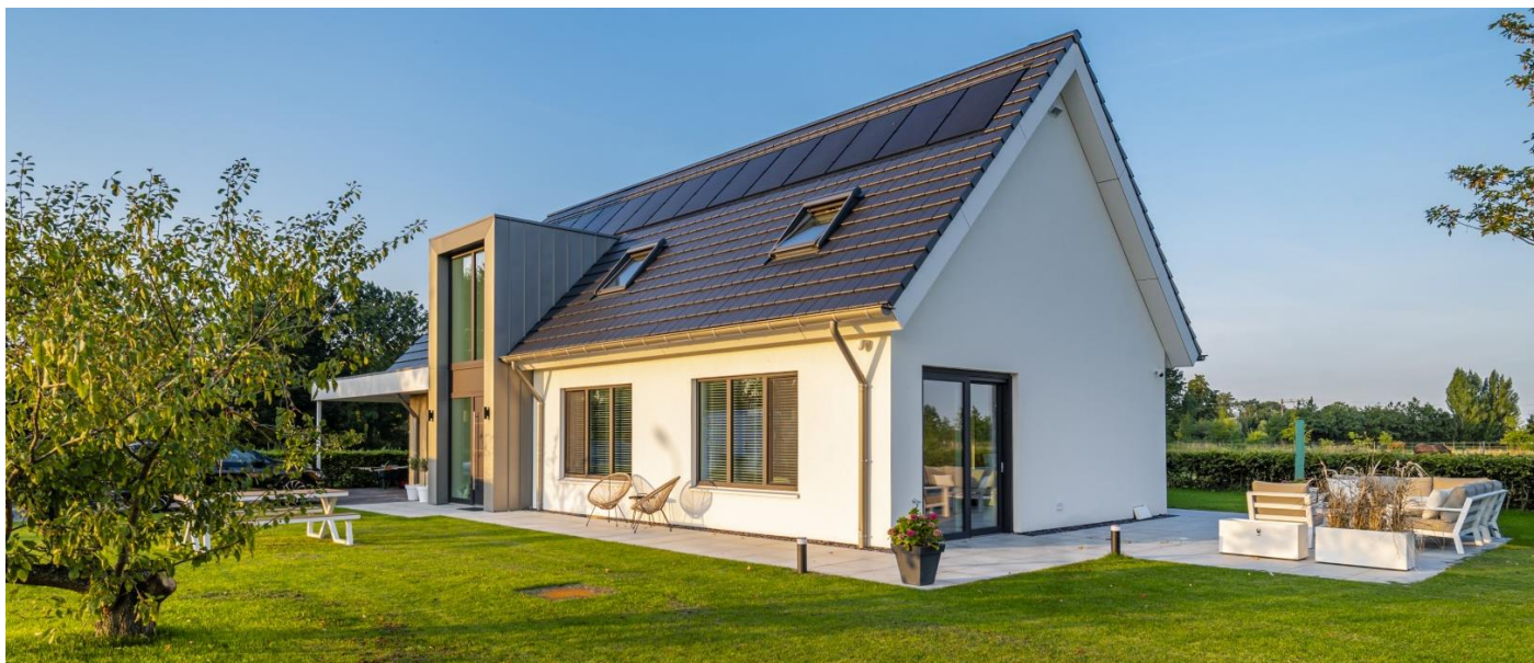
Verbouwing particuliere woning

De mogelijkheden van duurzaam wonen zullen de komende jaren steeds verder door ontwikkelen. Het is voor ons een mooie uitdaging om in dit proces mee te ontwikkelen en de kennis en kunde van de toekomst nu al in huis te halen. Dat betekent dat wij voortdurend investeren in mensen, materialen en opleiding.