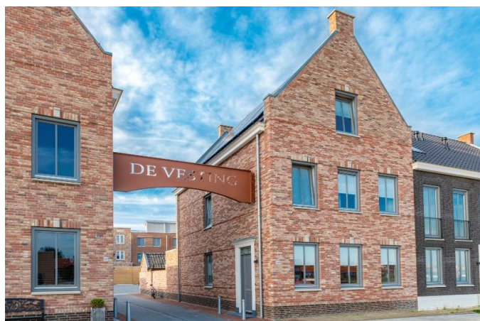
Nieuwbouwproject De Vesting in Vlissingen