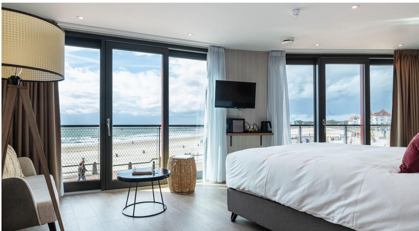
Verbouwing Hotelsuites Boulevard 17 Vlissingen

Het echt ambachtelijke werk lijkt haaks te staan op de technische ontwikkelingen in onze branche, maar ook dat vind je binnen onze gelederen. Bij restauraties, zoals bij monumenten, herstellen wij een gebouw naar de originele staat. Kennis van materialen en traditionele bouwmethoden is dan van groot belang. Gelukkig beschikken wij over mensen die op dat gebied hun vak verstaan. Je vindt dan ook met enige regelmaat bijvoorbeeld bijzonder houtwerk, zoals sierlijsten en kozijnen, voor herstel in onze werkplaats dat al veel ouder is dan ons bedrijf.