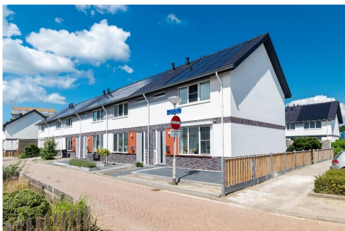
Verduurzaming huurwoningen Goese Polder

Hoe traditioneel ons vak van buiten gezien misschien ook lijkt, de ontwikkelingen en vernieuwingen volgen elkaar snel op. En dan met name op het gebied van duurzaam (ver)bouwen. De nieuwste technieken worden toegepast zodat de bouw van woningen én het comfortabel wonen een zo beperkt mogelijke impact hebben op onze natuurlijke omgeving. De lage energierekening is voor de bewoners natuurlijk een mooi bijkomend voordeel.